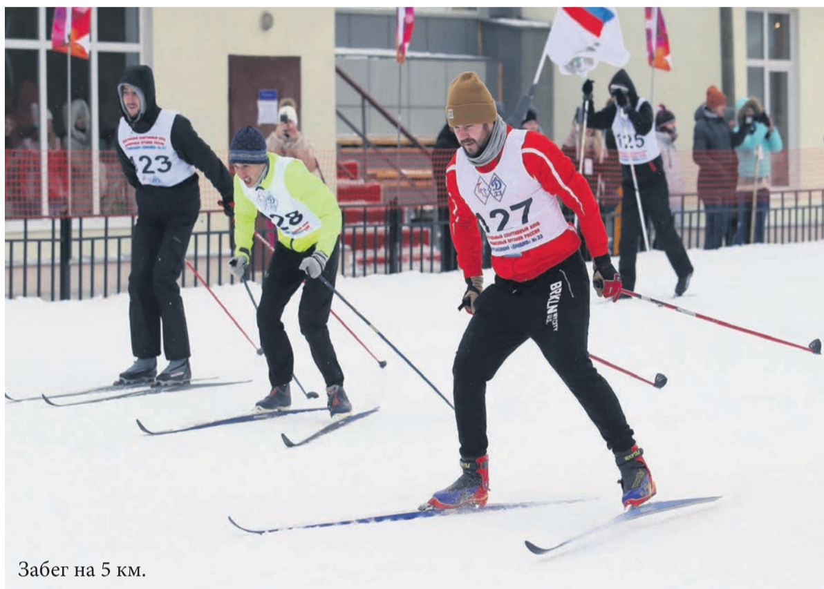
Забег на 5 км.

На открытие сезона поучаствовать в спортивных состязаниях были приглашены все желающие сотрудники финансовых органов. Оргкомитет заранее договорился о стоимости аренды лыж, которые разобрали вмиг, пришлось срочно брать дополнительные лыжи на прокат в городе Химки.