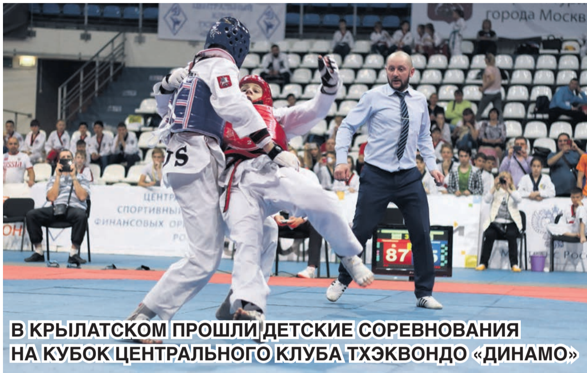
В КРЫЛАТСКОМ ПРОШЛИ ДЕТСКИЕ СОРЕВНОВАНИЯ НА КУБОК ЦЕНТРАЛЬНОГО КЛУБА ТХЭКВОНДО «ДИНАМО»

Открыл соревнования Юрий Чиханчин. «Российские спортсмены на протяжении многих десятилетий сохраняют лидирующие позиции по многим видам спорта, и сегодня мы с вами продолжаем эту хорошую традицию. В сущности — это патриотизм в действии. Уверен, что каждый из вас сможет внести свой вклад в дело популяризации тхэквондо, наших подлинно российских ценностей, в том числе и на международной арене», — сказал Чиханчин.